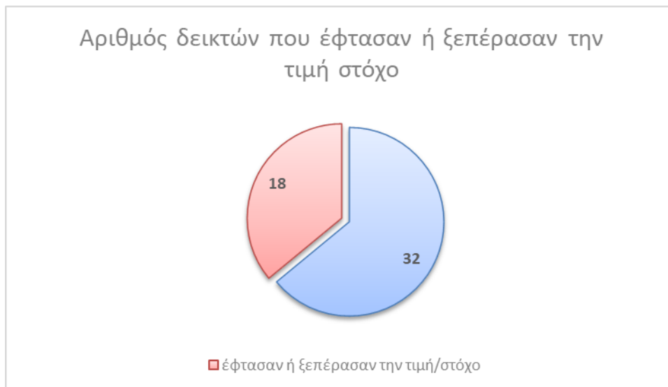
Σχήμα 2. Αριθμός δεικτών των οποίων η τιμή κατά το έτος 2018-19 έφτασε ή ξεπέρασε την τιμή/στόχο

Η τιμή σε δεκαοκτώ (18) δείκτες, κατά το ακαδ. έτος 2018-19, έφτασε ή και ξεπέρασε την τιμή/στόχο που είχε τεθεί κατά την στοχοθεσία ποιότητας (σχήμα 2).