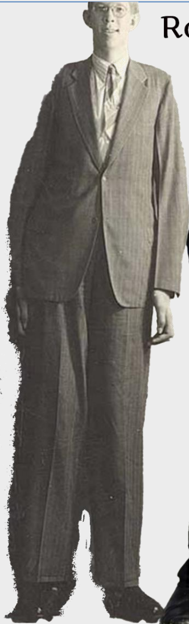
Robert Wadlow Tallest Person to ever live